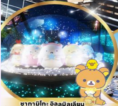
ซากา มิโตะ อิลลูมิเนชัน สัมภาระสูงสุดนำรถจากสาย SAN-X