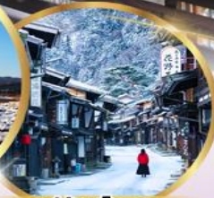
หมู่บ้านโบราณ นาราจิ จุกุ

ราคาเริ่มต้น 39,919 บาท รวมภาษีมูลค่าเพิ่ม 7%