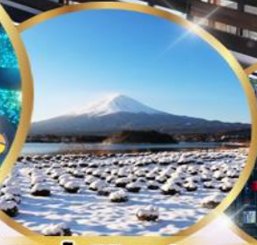
สวน โออิชิ พาร์ค